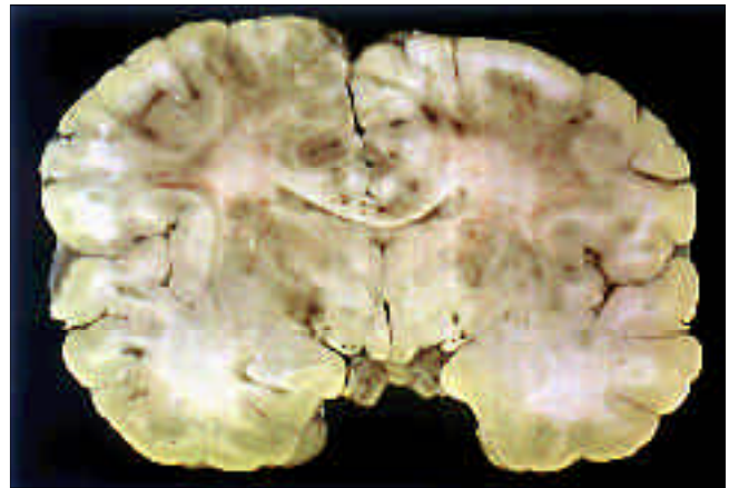
Figura 1. Corte coronal del cerebro pasando por los tálamos. Se observan numerosas lesiones petequiales en la sustancia blanca de ambos centros semiovais, cápsulas y cuerpo caloso.

El examen del LCR en la LAH revela habitualmente la pre-