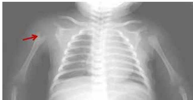
Figura 1 - Lesão hipotransparente ao nível da metáfise umeral direita.

articular com 4 mm de espessura e espessamento da sinovial, a favor de artrite séptica.