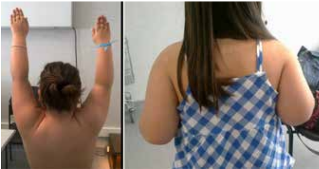
Figura 2 – Fotografias evidenciando encurtamento do membro superior direito.