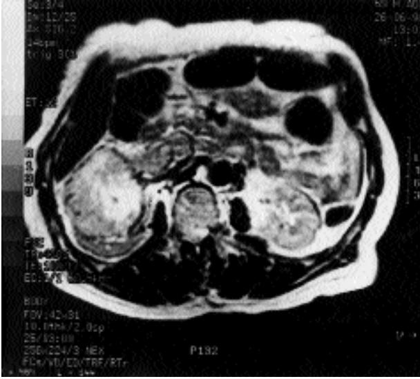
Figura 3. RMI-neoformación renal derecha. Trombosis de la vena renal derecha y de la VCI que se prolonga desde el hilio hasta la bifurcación de los vasos ilíacos.

En los pacientes con enfermedad extra-renal confinada a la existencia de trombo en la vena cava, el impacto en la supervivencia es limitado. Después de la nefrectomía radical y exéresis completa del trombo, estos enfermos tienen una supervivencia a los 5 años mejor que los enfermos con invasión de la cápsula (51 y 47% respectivamente). La invasión de los ganglios es por sí solo un factor de pronóstico adverso, apuntando las series más optimistas una supervivencia de 12-33%. La combinación de invasión vascular y de los ganglios linfáticos tiene una supervivencia a los 5 años descrita como 0% 4 . Es cuestionable la actitud quirúrgica en pacientes con enfermedad metastásica o con involucramiento de los ganglios linfáticos en ausencia de una terapéutica coadyuvante.