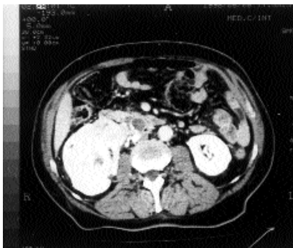
Figura 2. TAC-neoplasia renal derecha. Trombosis de la vena renal derecha y de la VCI.

claramente demostrado que la supervivencia de los enfermos con CCR y extensión a la VCI se encuentra significativamente asociada con invasión de la cápsula y de los ganglios linfáticos y con metastatización a distancia.